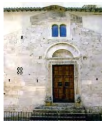
7. Portale cosmatesco San Giovanni Battista