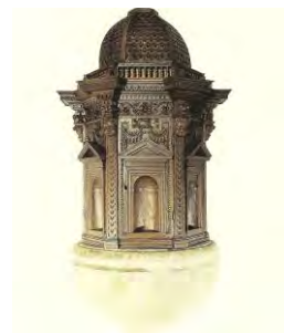
5. Portale lapideo San Francesco