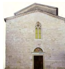
10. Facciata Chiesa del Duomo