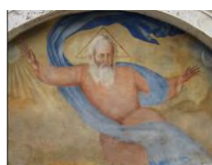
11. Lunetta con affresco Chiesa del Duomo