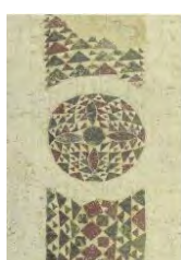
8. Facciata occid.part. San Giovanni B..