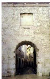
13. Porta Burgi Piazza San Francesco