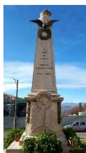
12. Monumento ai caduti