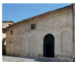
14. Facciata S.M. de Incertis (San Carlo)