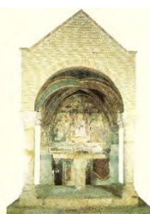
3. Madonna in trono con Bambino (San Carlo)