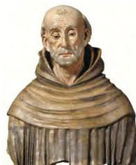
9. Busto San Bernardino Chiesa San Francesco