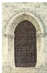
1. Portone ligneo San Francesco