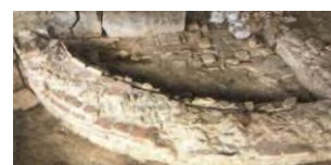
15. Struttura muraria B Terme di Carsulae

Si sono altresì conclusi i lavori della facciata di San Francesco, compreso il dipinto murale posto nella nicchia