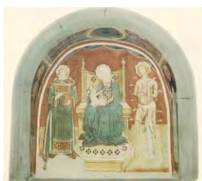
4. Madonna con Bambino tra santi (San Carlo)