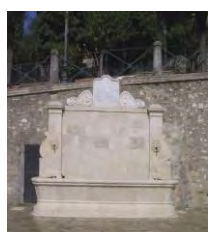
6. Fontana monumentale Piazza San Francesco